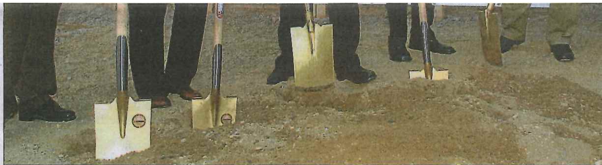
Müssen Nachbarn schon vor dem eigentlichen Genehmigungsverfahren für Projekte Einwendungen erheben können? [Michaela Bruckberger]

Das OLG Linz beschreitet mit dieser Entscheidung Neuland. Weil es noch keine höchstgerichtliche Entscheidung darüber gibt, hat es einen ordentlichen Revisionsrekurs an den Obersten Gerichtshof für zulässig erklärt. (kom)