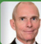
RA Dr. Frotz Experte f. Unternehmens- & Gesellschaftsrecht Frotz RAe OG