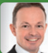
RA Dr. Konwitschka Experte f. Gesellschafts- & Versicherungsrecht Schönherr RAe