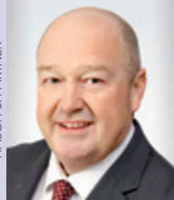
StB/UB Mag. SCHÜTZINGER Orange Cosmos